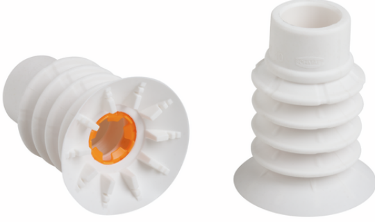
SPB4f 40 SI-HD-65 SC080

Entegre torba sabitleyicili vantuz SPB4f (elastomer parça + bağlantı elemanı) monte edilmiş olarak teslim edilir. Alternatif olarak münferit parçalar ayrı ayrı da sipariş edilebilir. Bunun için aşağıdaki sipariş adımları gereklidir: