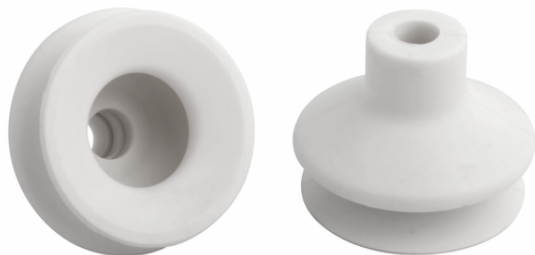
FGA 22 SI-HD-65 N016