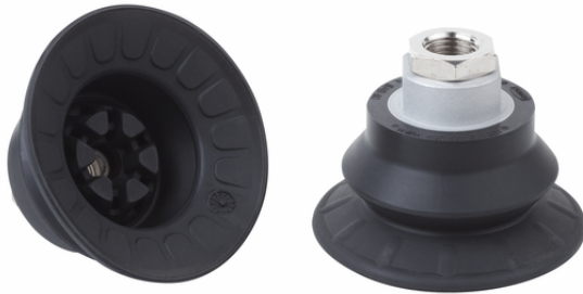
SAB 80 HT2-65 G1/4-IG

La ventosa SAB HT2, disponibile in diversi diametri, viene fornita con nipplo di connessione vulcanizzato a la parte in elastomero.