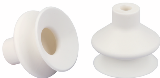
FGA 25 SI-HD-65 N016