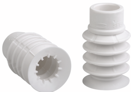
SPB4 30 SI-HD-65 SC080