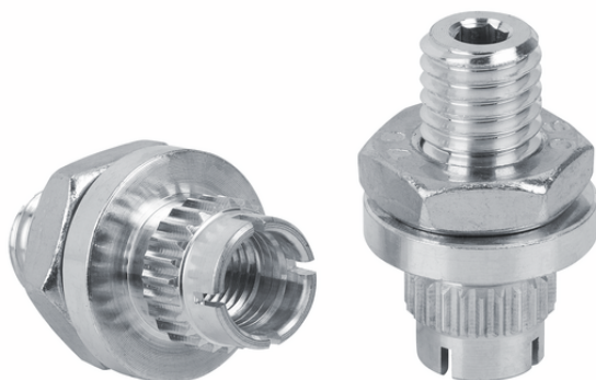
SC-A 055-AR M10-AG L