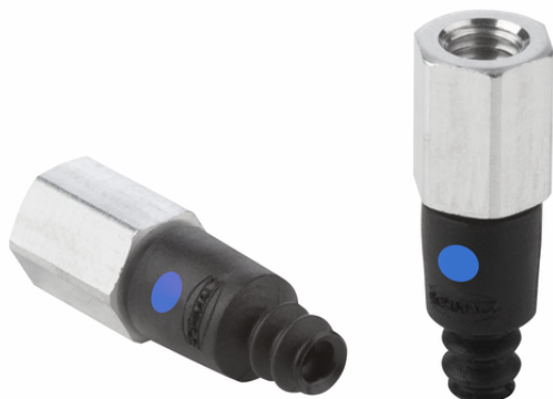
FSG 4 NBR-CO-55 M5-IG