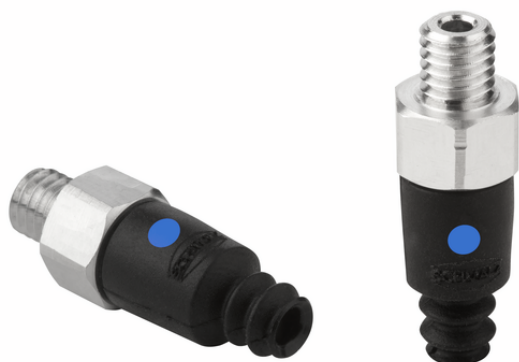
FSG 4 NBR-CO-55 M5-AG