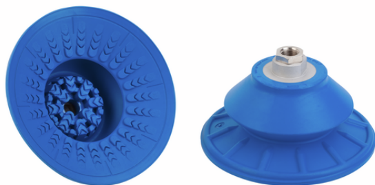
SAB 125 HT1-60 G1/4-IG

La ventosa SAB HT1, disponibile in diversi diametri, viene fornita con nipplo di connessione vulcanizzato a la parte in elastomero.