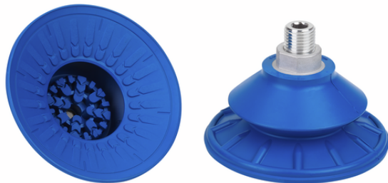
SAB 100 HT1-60 G3/8-AG

La ventouse SAB HT1, disponible en différents diamètres, est livrée avec insert de connexion vulcanisé à la ventouse en élastomère.