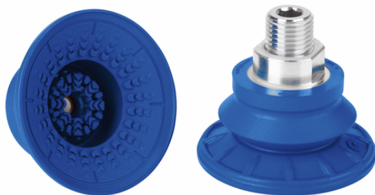
SAB 60 HT1-60 G1/4-AG

La ventosa SAB HT1, disponible en diversos diámetros, se suministra con boquilla de conexión vulcanizada en la pieza elastomérica.