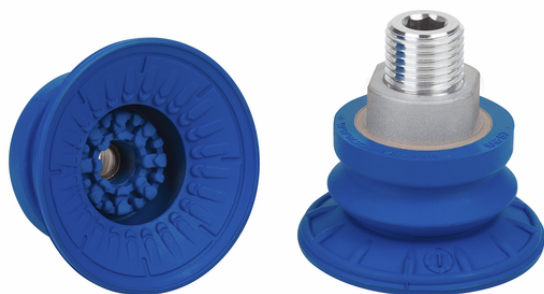
SAB 50 HT1-60 G3/8-AG

La ventosa SAB HT1, disponibile in diversi diametri, viene fornita con nipplo di connessione vulcanizzato a la parte in elastomero.