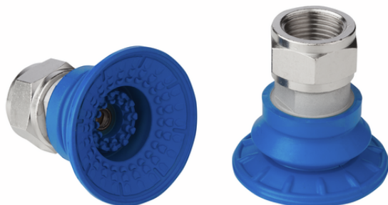
SAB 40 HT1-60 G3/8-IG

La ventosa SAB HT1, disponibile in diversi diametri, viene fornita con nipplo di connessione vulcanizzato a la parte in elastomero.