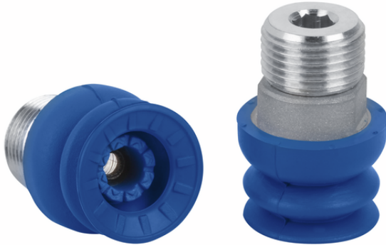
SAB 22 HT1-60 G3/8-AG

La ventosa SAB HT1, disponibile in diversi diametri, viene fornita con nipplo di connessione vulcanizzato a la parte in elastomero.