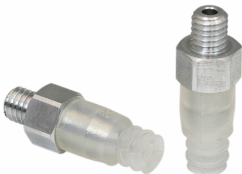
FSG 4 SI-55 M5-AG