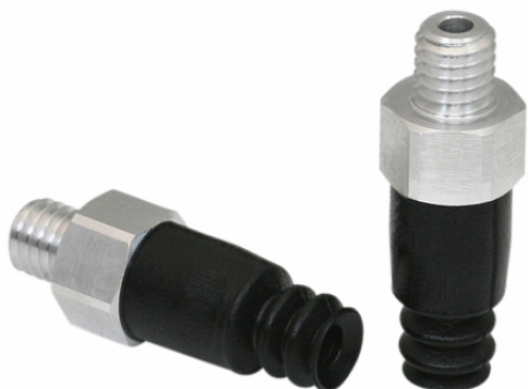
FSG 4 NBR-55 M5-AG