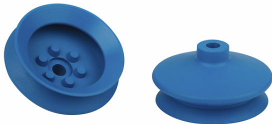
FGA 63 HT1-60 N018