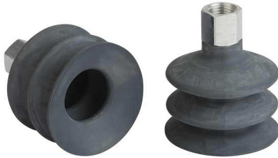
FSG 52 NK-45 G1/4-IG