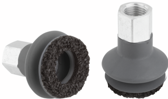
FSGA 33 NK-45 G1/4-IG DR

Der Balgsauggreifer mit Dichtring, verfügbar in verschiedenen Durchmessern, wird mit angeklebtem Dichtring geliefert.