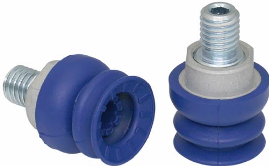
SAB 22 NBR-60 M10-AG

Der Sauggreifer SAB, verfügbar in verschiedenen Durchmessern, wird mit anvulkanisiertem Anschlussnippel geliefert.