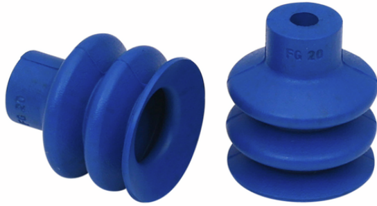
FG 20 HT1-60 N016