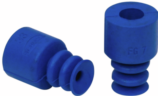
FG 7 HT1-60 N016