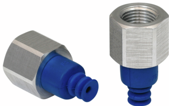
FSG 7 HT1-60 G1/8-IG