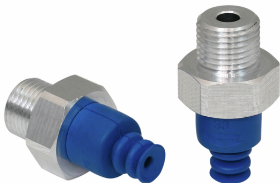
FSG 7 HT1-60 G1/8-AG