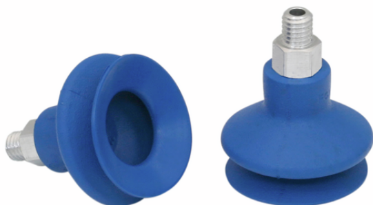
FSGA 22 HT1-60 M5-AG