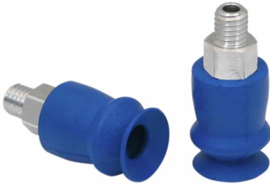
FSGA 11 HT1-60 M5-AG

La ventosa FSGA (pieza elastomérica + boquilla de conexión) se suministra desmontada (a partir del diámetro 33 mm montada). El suministro se compone de: