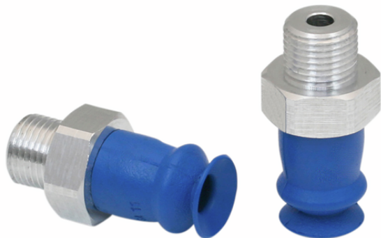
FSGA 11 HT1-60 G1/8-AG