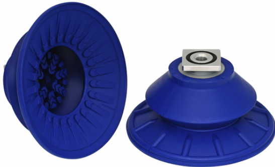
SAB 125 NBR-60 RA

La ventosa SAB disponible en diversos diámetros se suministra con boquilla de conexión vulcanizada en la pieza elastomérica.