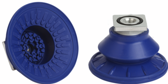
SAB 80 NBR-60 RA

La ventouse SAB, disponible en différents diamètres, est livrée avec insert de connexion vulcanisé à la pièce en élastomère.