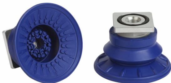
SAB 60 NBR-60 RA

真空パッド SABは、接続ニップル (取付ネジ) が取り付けられた状態で納品されます。様々なサイズのパッドをラインアップしています。