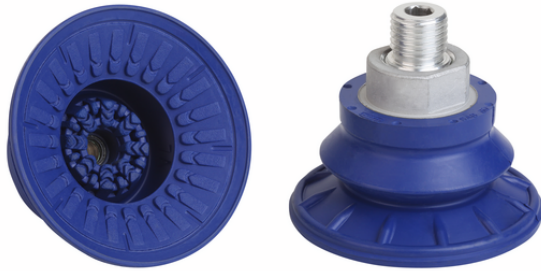
SAB 60 NBR-60 M14x1.5-AG

La ventosa SAB disponible en diversos diámetros se suministra con boquilla de conexión vulcanizada en la pieza elastomérica.