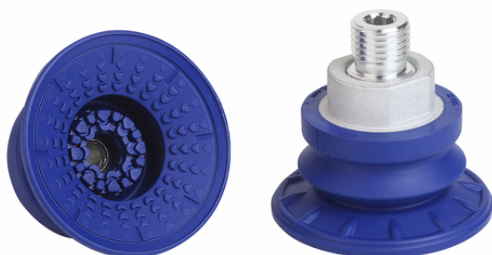
SAB 50 NBR-60 M14x1.5-AG

真空パッド SABは、接続ニップル (取付ネジ) が取り付けられた状態で納品されます。様々なサイズのパッドをラインアップしています。