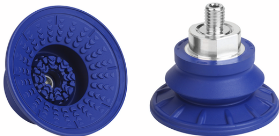
SAB 60 NBR-60 M10-AG

La ventosa SAB disponible en diversos diámetros se suministra con boquilla de conexión vulcanizada en la pieza elastomérica.