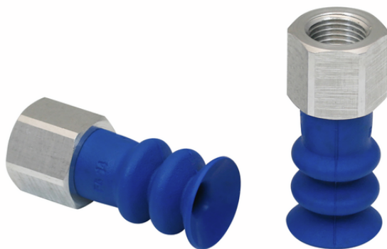
FSG 14 HT1-60 G1/8-IG