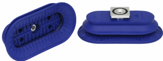
SAOB 140x70 NBR-60 RA

La ventouse SAOB, disponible en différents diamètres, est livrée avec insert de connexion vulcanisé à la pièce en élastomère.