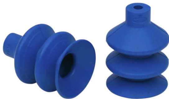
FG 25 HT1-60 N016