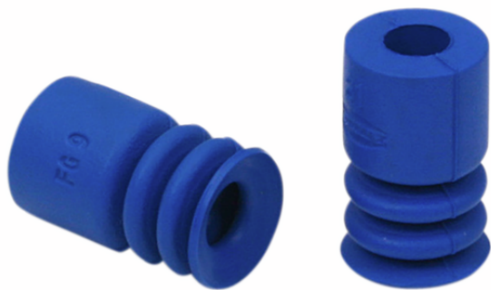
FG 9 HT1-60 N016