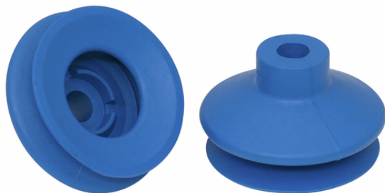
FGA 43 HT1-60 N018