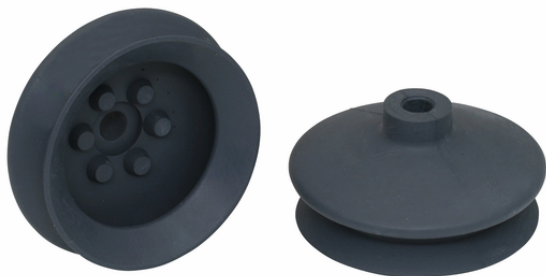
FGA 63 NK-45 N018