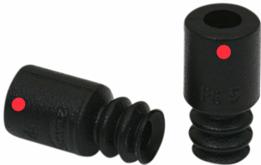
FG 5 SI-CO-55 N017