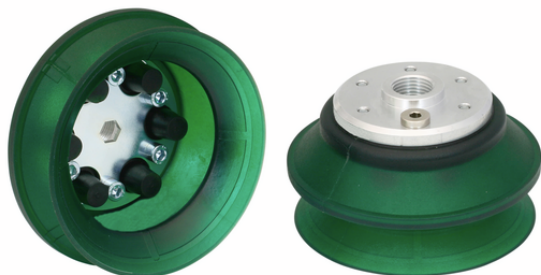
FSGA 110 VU1-72 G1/2-IG ON