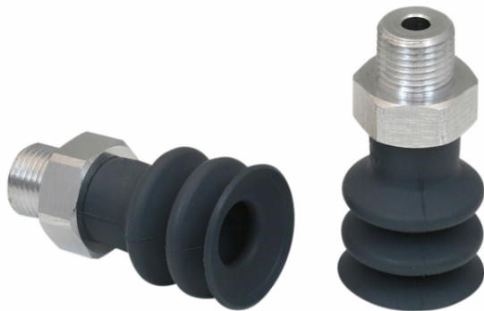
FSG 18 NK-45 G1/8-AG