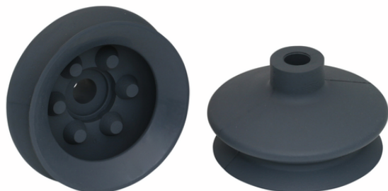
FGA 78 NK-45 N019