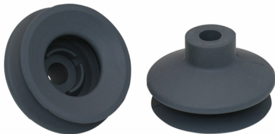
FGA 43 NK-45 N018