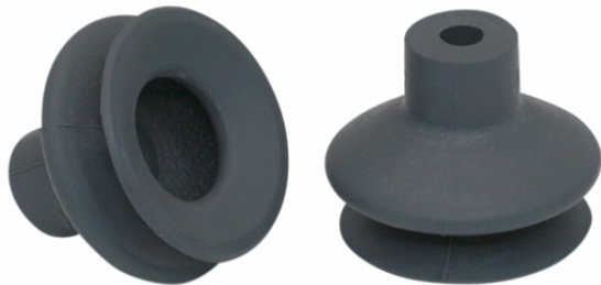
FGA 22 NK-45 N016