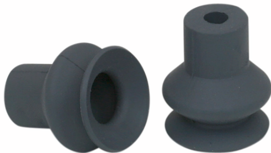
FGA 16 NK-45 N016