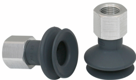
FSGA 22 NK-45 G1/8-IG