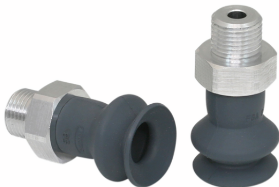
FSGA 16 NK-45 G1/8-AG