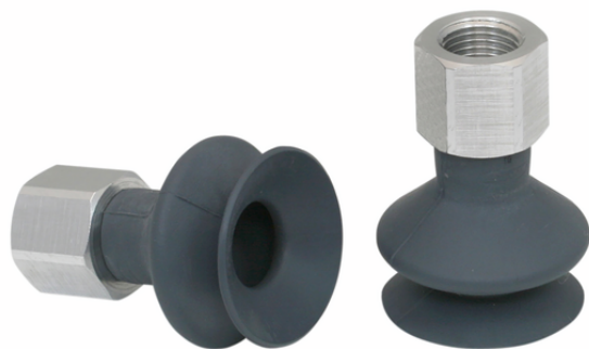
FSGA 25 NK-45 G1/8-IG