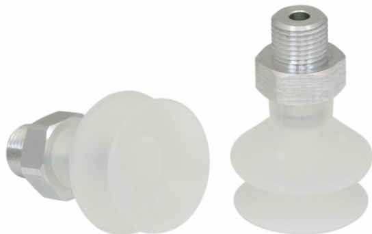
FSGA 25 SI-55 G1/8-AG